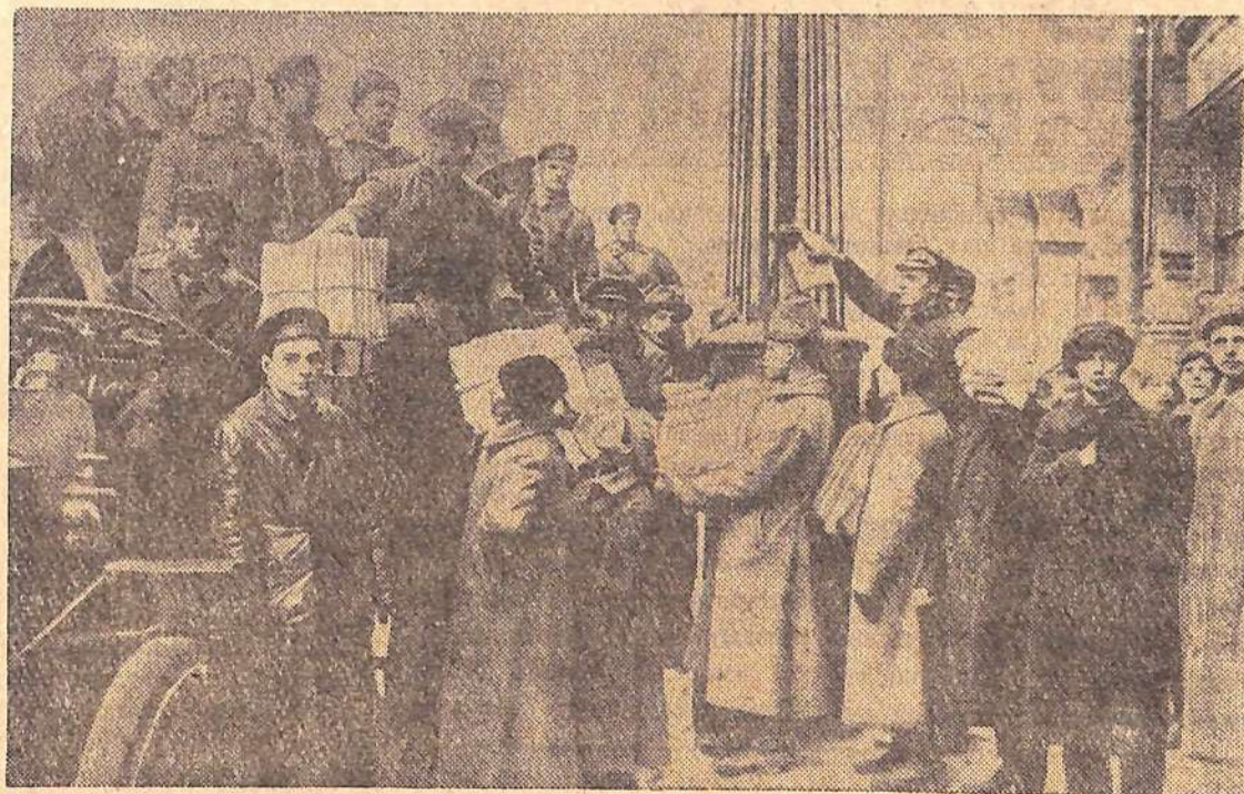
Фото документы из истории Великого Октября. Раздача газет в первый день заседания Советов в Москве. (Из материалов Цент-

Исключительно высоким будет уровень автоматизации. (АПН)