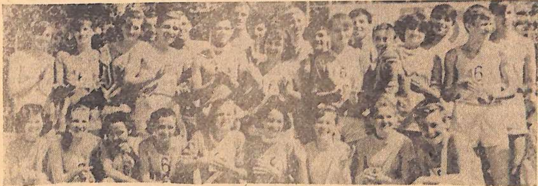
Команда-победительница шестой школы—обладательница кубка эстафеты 1966 и 1967 годов.