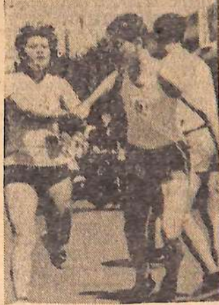
Передача эстафетной палочки.

малозаметный разрыв явным, солидным. Команда Саратовгэстроя прошла дистанцию за 19 минут 36,8 секунды. А через 2,7 секунды позже финишную прямую пересекли и химики.