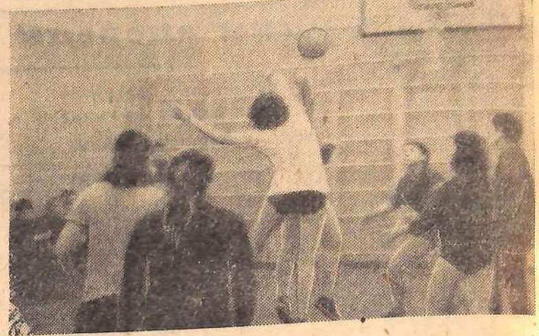
В химико-технологическом техникуме созданы волейбольная, баскетбольная, футбольная, теннисная и другие спортивные секции, в которых занимаются учащиеся. Для проведения занятий секций в техникуме имеется хорошо оборудованный спортивный зал. На снимке: занятия баскетбольной секции.