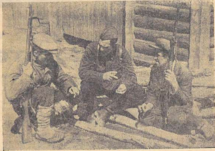
Советский народ в Великой Отечественной войне. С самого начала войны на советской земле широко развернулось партизанское движение. Партизаны громил тылы вражеских войск, мешали их движению, нарушали связь, наносили врагу серьезные потери.

На снимке: командир партизанского отряда беседует с крестьянами — членами группы самозащиты.