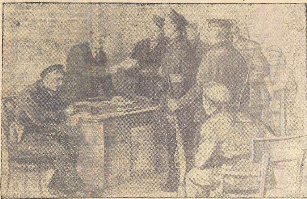
В. И. Ленин в октябрьские дни дает распоряжение матросам Балтийского флота занять телефонную станцию.

(Картина заслуженного деятеля искусств РСФСР П. Васильева).