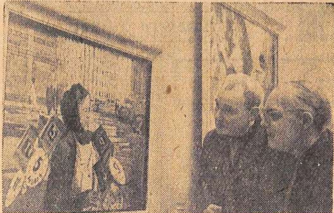
Москва. В Академии художеств СССР открыта выставка произведений изобразительного искусства, выдвинутых на соискание Ленинских премий 1967 года. На снимке: у картины художника Ю. И. Пименова «Новые номера» из серии «Новые кварталы».