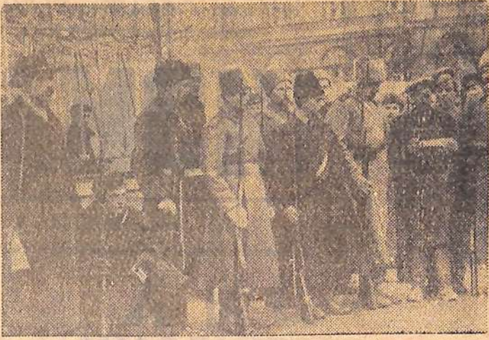
Петроград. Проверка мандатов у Смольного. 1917 год. (Снимок из музея истории Ленинграда). Фотохроника ТАСС