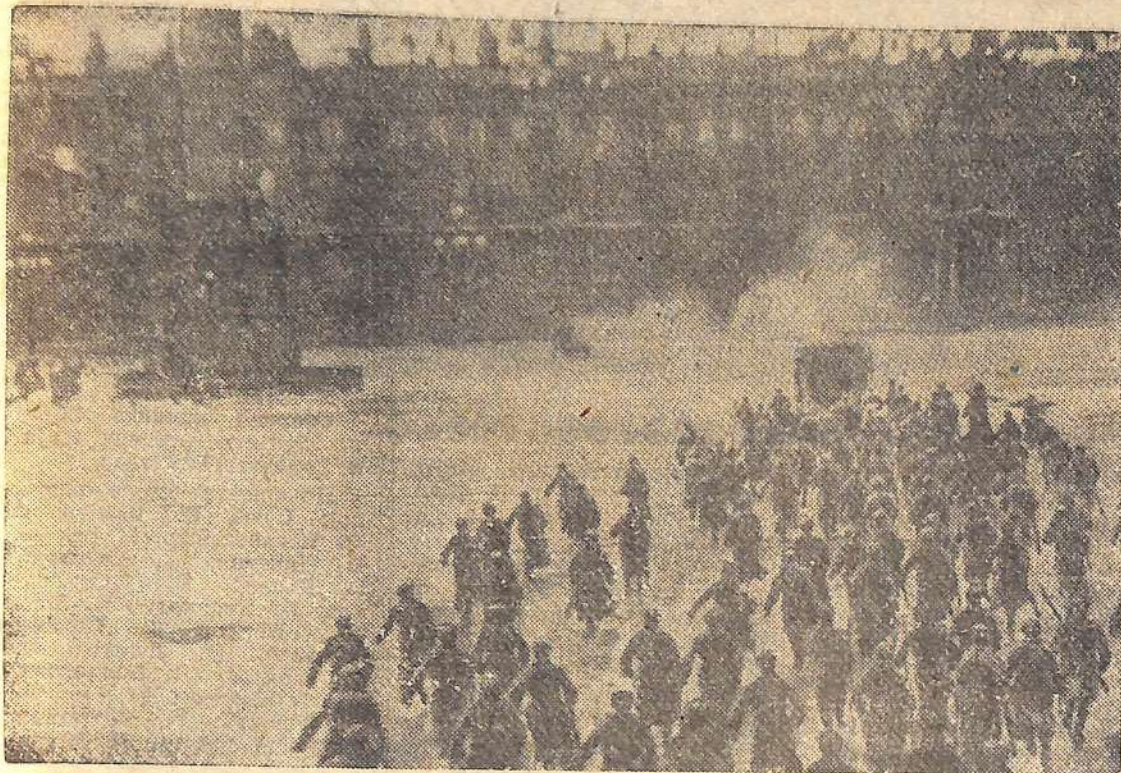
Петроград. 1917 год. Штурм Зимнего дворца.