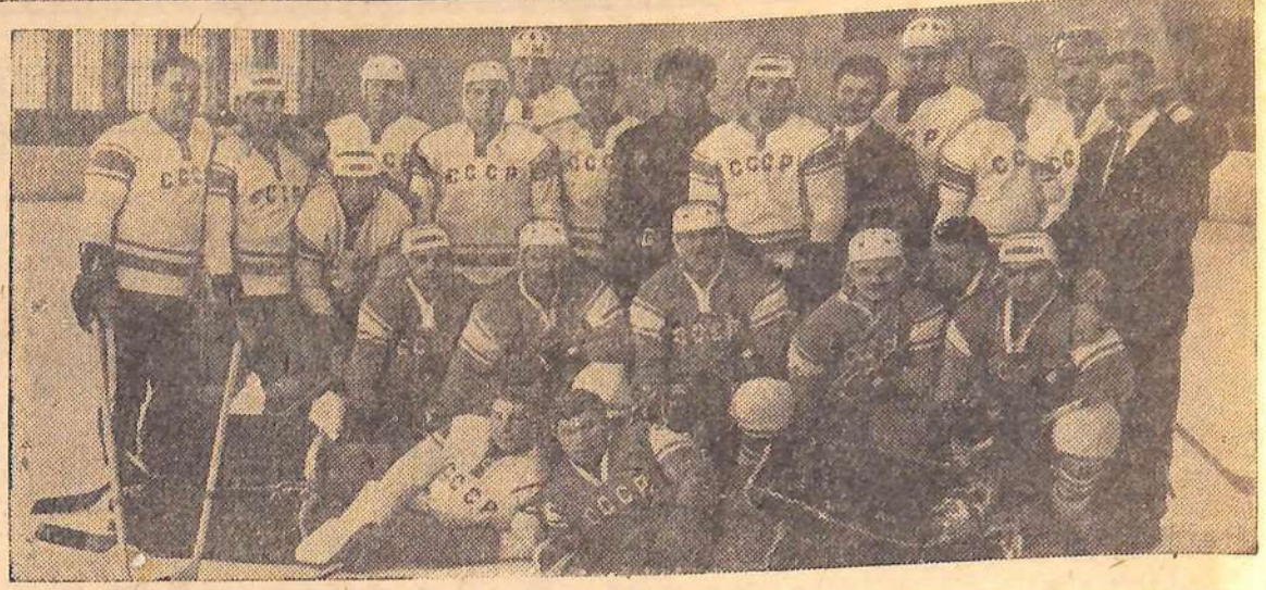
Сборная команда СССР по хоккею — чемпион мира и Европы 1967 года.

Октябрь. Сегодня — широкоэкранный цветной фильм ТРИ ТОЛСТЯКА; МАНДАТ, завтра — ГОРЬКИЙ РИС; КОРОЛЕВА — ЗУБНАЯ ЩЕТКА. Начало сеансов в 9, 11, 13, 15, 17, 19 и 21 час.