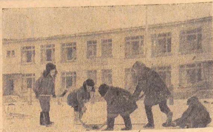
Хоккей—одна из любимых игр нашей детворы. Каждый день идут жаркие «схватки» во дворах.

Д. ВАСИЛЕНКО, электромонтер энергоучастка.