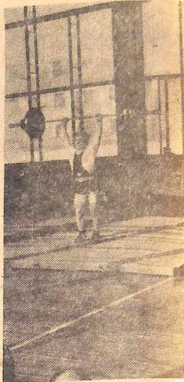
Некоторое время тому назад проходили соревнования тяжелоатлетов на лично-командное первенство города. Первое место в них заняла команда Саратовгэстроя. На снимке М. Бабенко запечатлен один из моментов этого соревнования.

Фотографии следует присылать в адрес городского совета спортивных обществ и организаций в пакете или конверте с указанием фамилии, имени, отчества автора, его возраста, профессии и местожительства. Минимальный размер фотографии 13x18 сантиметров. Обязательно присылать негатив.