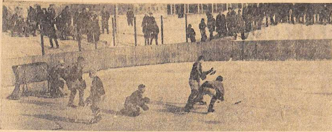
Продолжается первенство города по хоккею с шайбой. На снимке: один из моментов игры.