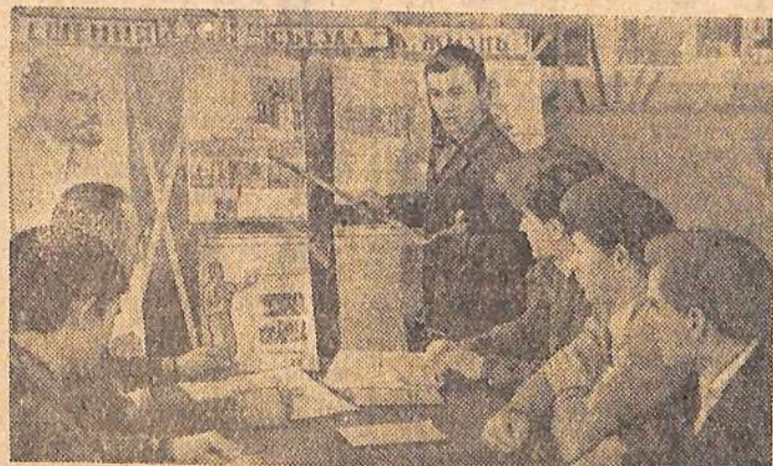
В красном уголке общежития № 19 Саратовгэсстроя есть фотовыставка, много литературы к выборам в Верховный Совет РСФСР и местные Советы депутатов трудящихся.

Вечер молодых избирателей закончился концертом художественной самодеятельности. П. НАУМОВ.