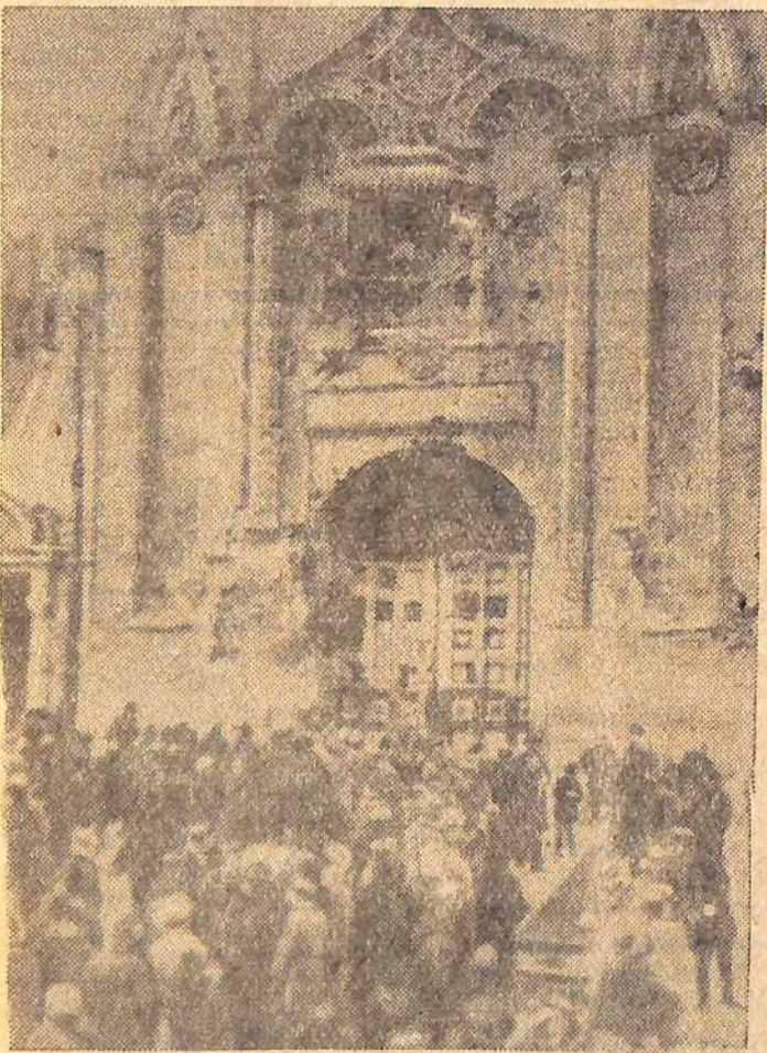
Ноябрь 1917 года. Кремль взят. У Никольских ворот.