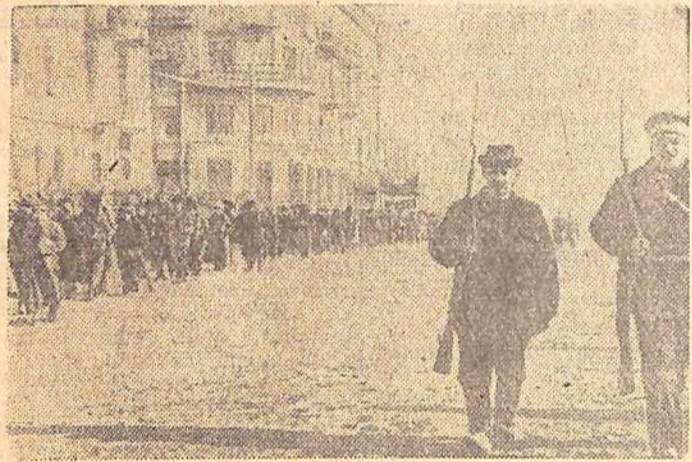
Чита. 1917 год. Красная гвардия.

Организовать Советскую власть в г. Иркутске, отстранив агентов Временного правительства Керенского и подчинив Советской власти все местные правительственные учреждения».