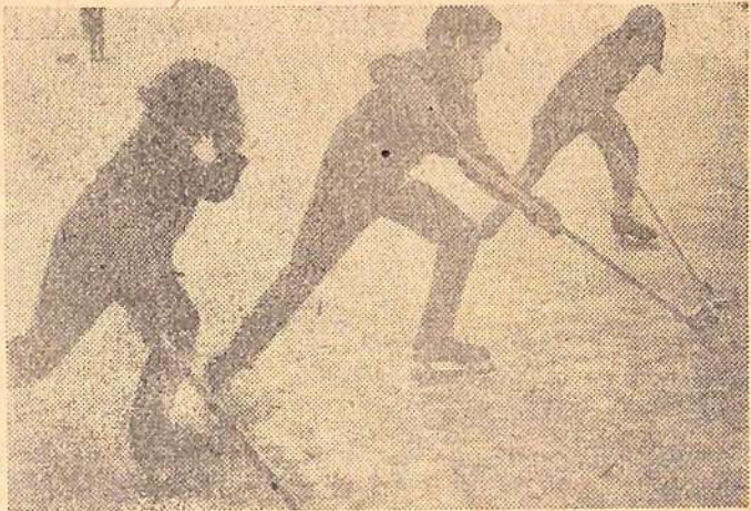
Нет лучшего отдыха для мальчишек, чем игра в хоккей.