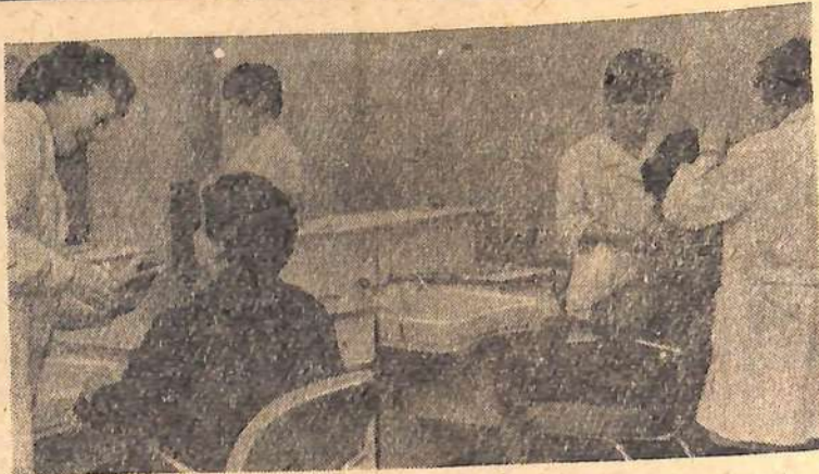
Все новые и новые объекты бытового обслуживания открываются в нашем городе. Во втором микрорайоне работает специальный салон для женщин. Опытные мастера делают красивые и модные прически.

Каждый второй дом колхозника сельхозартели имеет телевизор.