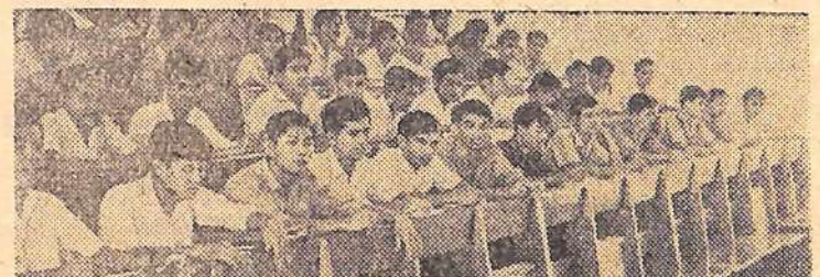
На снимке: на занятиях в одной из аудиторий института, построенного с помощью Советского Союза.

Пном-Пень (Камбоджа) Национальный технологический институт икхmero - советской дружбы — кузница новых кадров независимой страны. Молодежь учится с большим энтузиазмом. Они знают, что будущее родины в их руках.