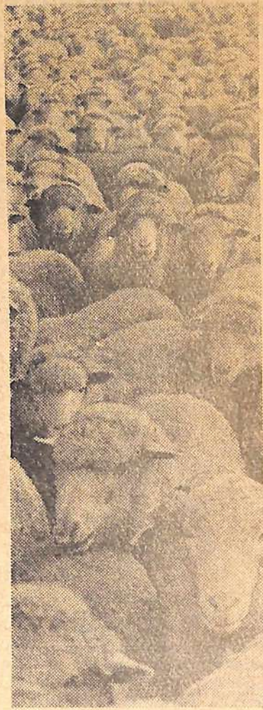
На овцеферме совхоза «Зоркинский».

Но работа по комплектованию племенных групп маточного стада необоснованно за-