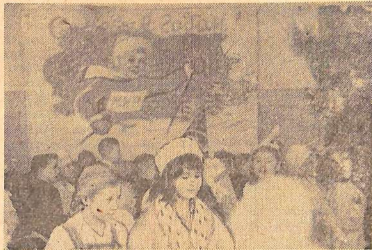
В школах, Дворце пионеров, клубах в эти дни продолжаются новогодние представления. Елки, подарки, сюрпризы... Детвора веселится.