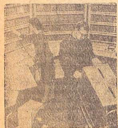
Москва. В вычислительном центре Академии наук СССР вступает в эксплуатацию электронная вычислительная машина «ВЭСМ-6».