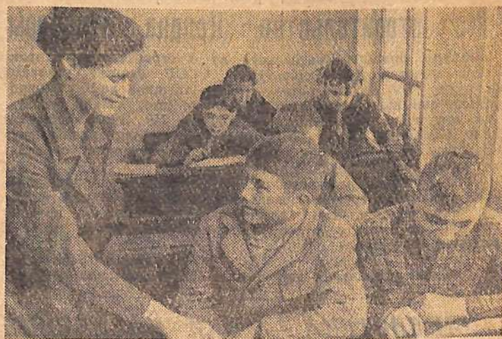
При Мало-Перекопновской школе есть интернат, в котором живут учащиеся отдаленных поселков. Воспитатели и учителя настойчиво борются, чтобы у школьников были прочные знания.