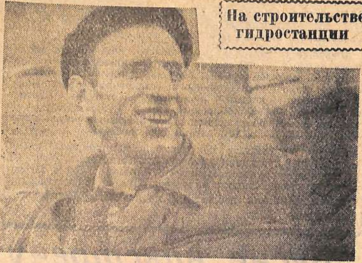
На строительстве гидростанции