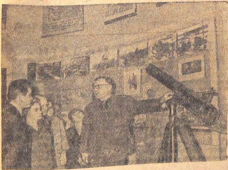
Москва. В Государственном историческом музее открылась выставка, посвященная 25-летию разгрома немецких фашистов под Москвой. На снимке: в одном из залов выставки.

Новинка автоматки, представленная на ВДНХ СССР, вызвала большой интерес у специалистов машиностроения, ВДНХ