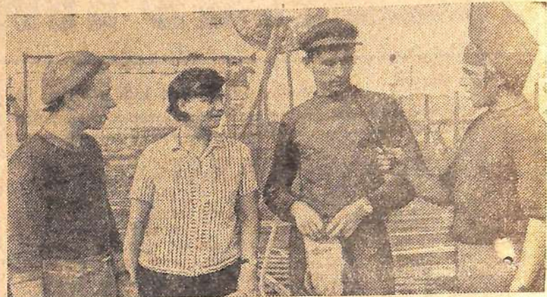
На пусковых объектах