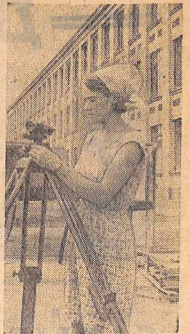
Прежде чем широкая трасса примет транспорт, предстоит много поработать строителям. И первыми ведут дороги геодезисты.

Избиратели рекомендовали работникам милиции теснее держать связь с населением и с его помощью вести непримиримую борьбу с нарушителями общественного порядка.