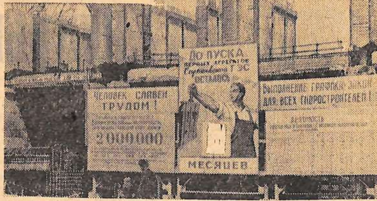
Установленное в центре котлована гидростанции красочное панно напоминает строителям о сроках, оставшихся до затопления котлована, и задачах коллективов управлений, занятых на объектах гидроузла.