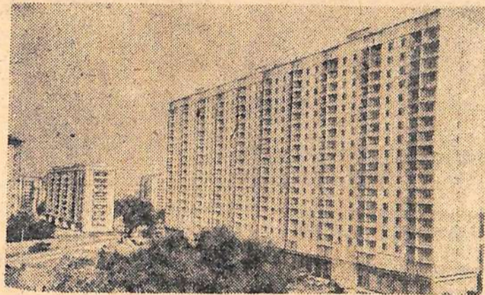
Закончен монтаж первого в Москве экспериментального 17-этажного здания из вибропрокатных деталей. Жилая площадь этого дома, который находится на проспекте Мира, 12 тысяч квадратных метров, в нем 384 квартиры.