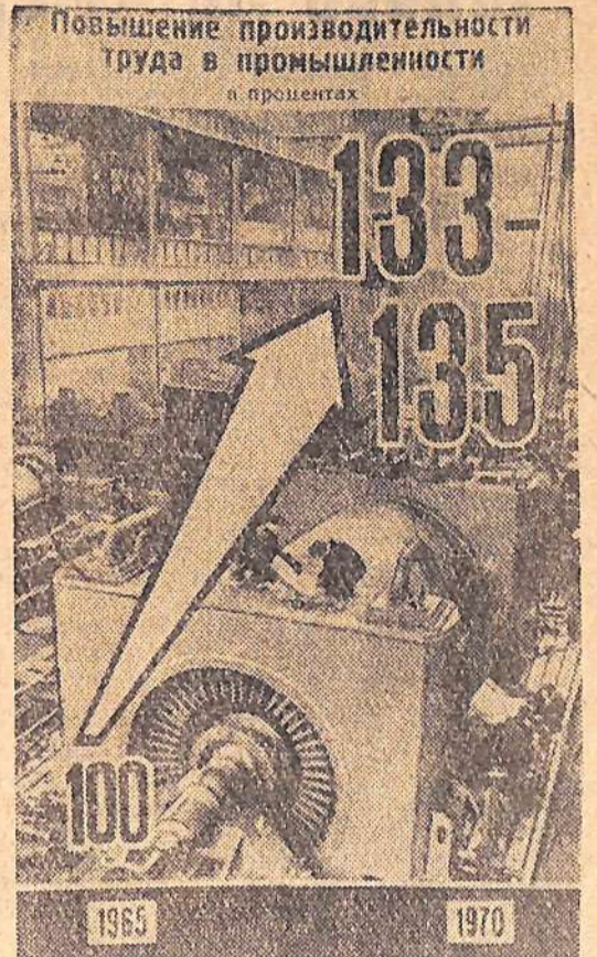
Повышение производительности труда в промышленности (в процентах).