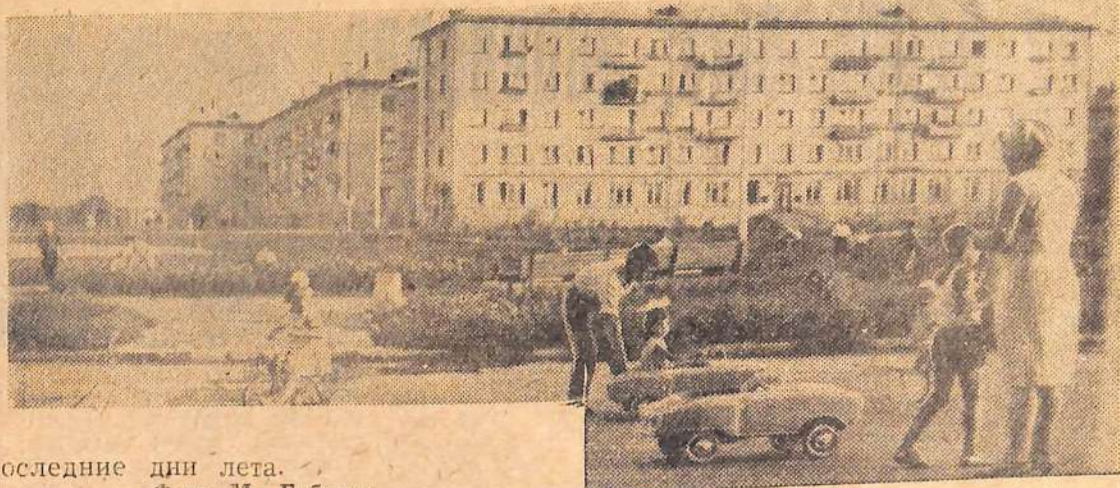
Последние дни лета.

16-50 — Интервидение. Гдаьск и Поморье в польской музыке. Передача из Варшавы. 17-20 — Всесоюзный фестиваль самодельного искусства. «Добрые руки». Музыкальная передача. 18-00 — «Хозяева подземных кладовых». К Дню работников нефтяной и газовой промышленности. 18-30 — Музыкальный киоск. 19-00 — «Мифы XX века». 19-30 — «Мастера искусств». Творческий портрет артиста польского кино и театра Т. Ломницкого. 21-00 — Теленовости. 21-30 — «Вызываем огонь на себя». Телефильм. Четвертая серия. 22-35 — «Эстрадно-танцевальный вечер». 23-15 — В эфире «Молодость».