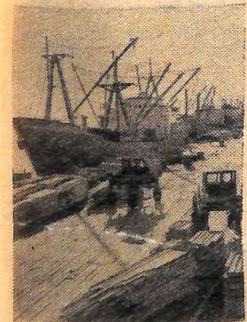
Архангельская область. Тесно океанским судам у причала Онежского морского порта. Сюда за пиломатериалами приходят суда под флагами СССР и многих зарубежных стран. На снимке: погрузка судов у причала Онежского морского порта.