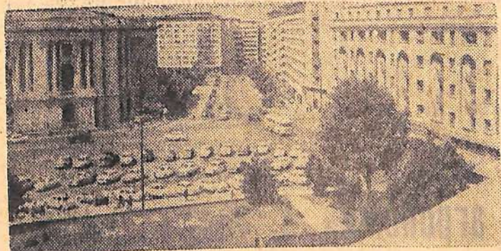
Бухарест. Площадь Республики.

Спецуправлению «Волго-энергомонтажизоляция» ТРЕБУЮТСЯ изолировщики, плотники, жестянщики, ученики изолировщиков. Принимаются лица, не моложе восемнадцати лет. Обращаться по адресу: Балаково, ТЭЦ-4, участок теплоизоляции СУ ВЭМИ. 2—2