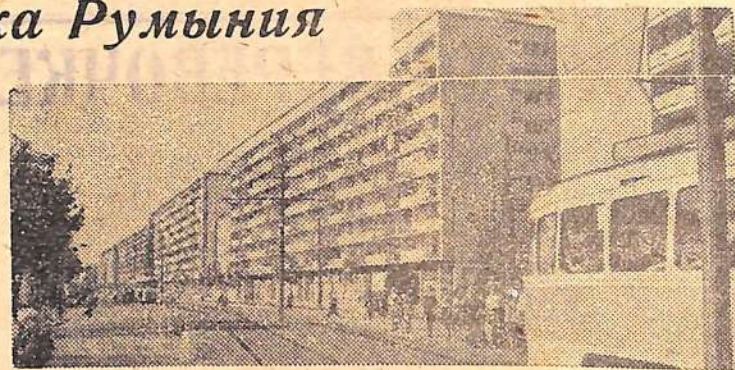
Новые жилые дома на магистрали Север-Юг в Бухаресте.

В настоящее время трудолюбивый румынский народ приступил к выполнению плана первого года нового пятилетия. Считая своим интернациональным долгом неуклонно развивать братские отношения со всеми социалистическими странами, Румыния вносит свой вклад в единство и сплоченность мировой социалистической системы.