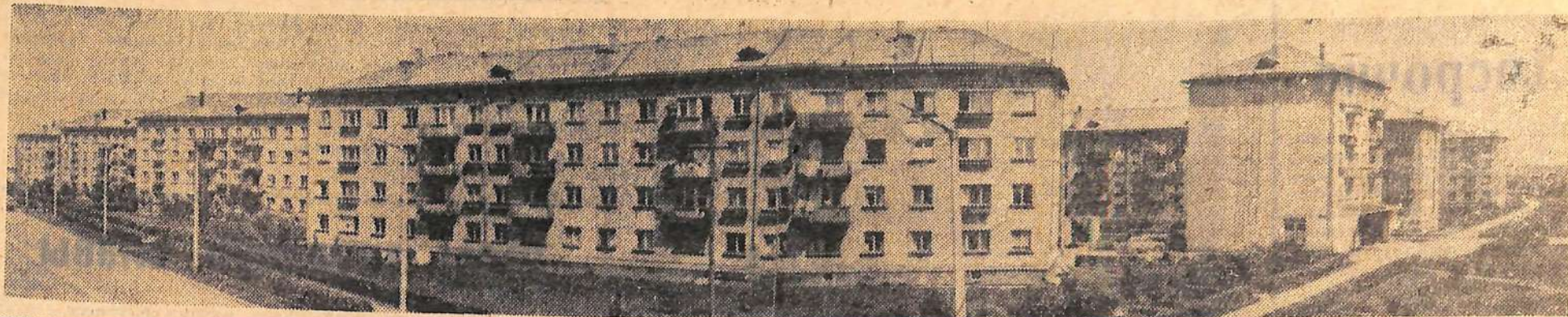
Наш город сегодня.