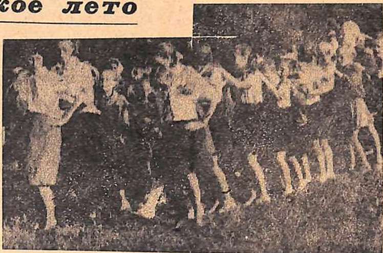
Разучивание нового танца.