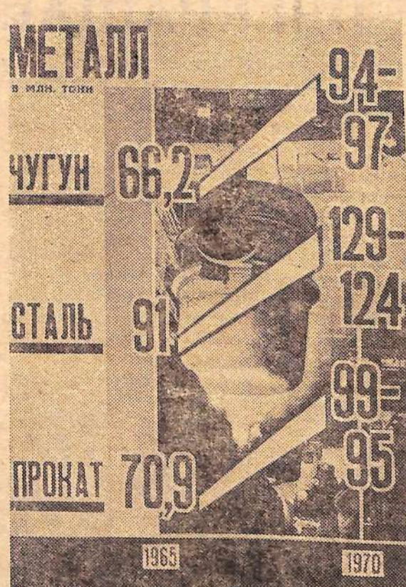
Производство металла в млн. тонн.