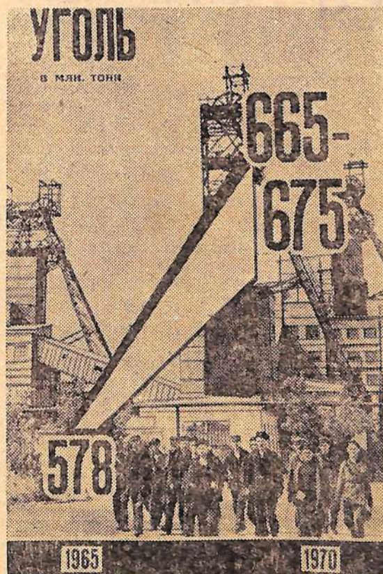
Добыча угля в млн. тонн.