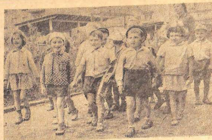
Воспитанники детского сада № 14 идут на прогулку. Весело им, интересно. Воспитательница рассказывает о новых строящихся домах, о городе.