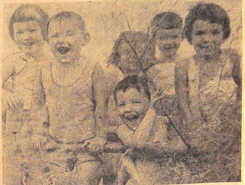
Весело ребятишкам в детсаду № 15. Целый день они на воздухе, играют, резвятся.

Волнует его и то, что в коллективе нет учителей с высшим образованием. — Хотя бы иметь преподавателей русского языка, литературы и математики, — говорит директор. Все, что требовалось от дирекции, сделано. Школа к приему детей готова. Я. ПЕТРОВА.