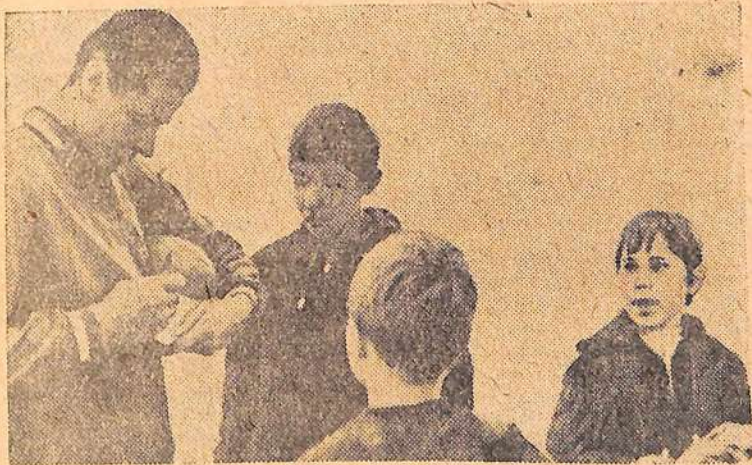
Чемпионат мира по футболу в Англии. На снимке: Лев Яшин дает автографы юным любителям футбола.