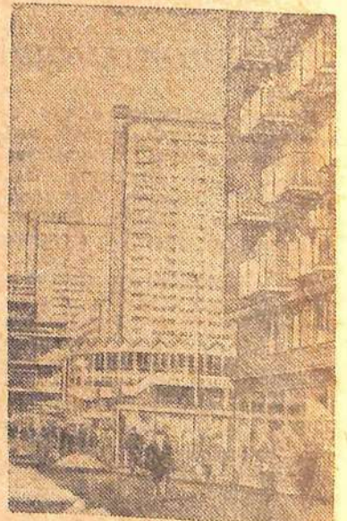
Из руин и пепелищ волей и трудом всего польского народа возстала Варшава. Вновь обрела свой прежний облик реставрированные дома старого города, радуют глаз богатством красок и форм центральные улицы и новые жилые кварталы.