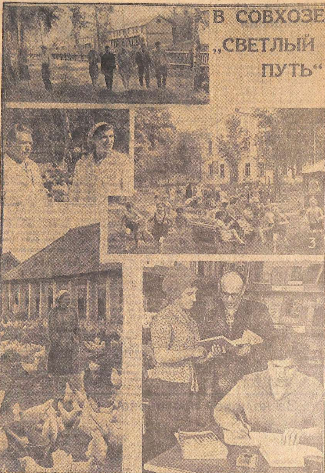
В СОВХОЗЕ „СВЕТЛЫЙ ПУТЬ“

Совхоз «Светлый путь» Первомайского района Алтайского края готовится к переходу на полный хозяйственный расчет. В последние годы хозяйство специализировалось на птицеводстве и стало рентабельным.