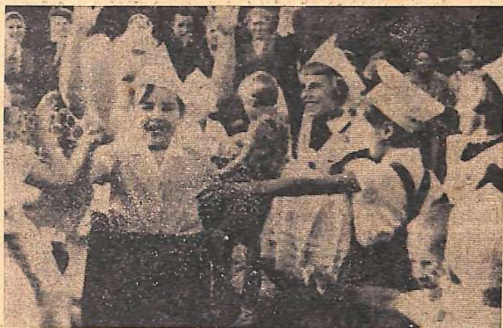
Малыши затеяли игру. Весело им, каждому хочется победить.