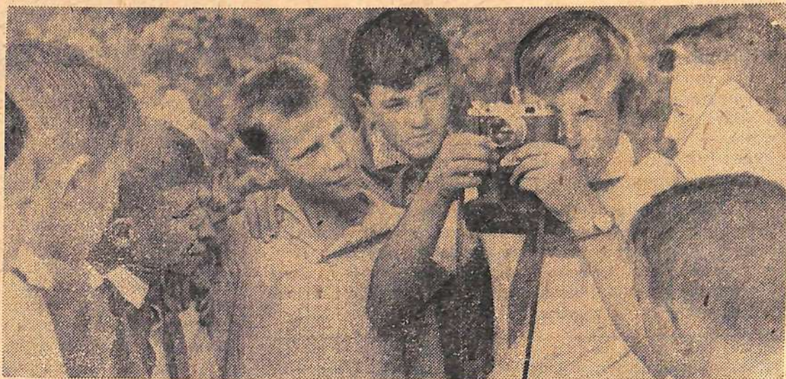
Фотолюбители лагеря «Дружба» нашли интересный объект для съемки.

Ребята первой смены оставили после себя хорошие дела. Из похода в Натальино они принесли много инте-