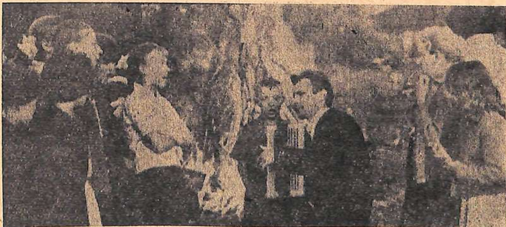
Легли сумерки. Пылает пионерский костер. А ребята поют свои любимые песни.

В лагере работают музыкальный, вокальный, танцевальный кружки, кружок художественного чтения. Каждый вечер ребята собираются на эстрадной площадке. Если нет кинокартины, то поют песни, разучивают танцы.