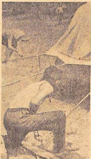
Палатки разбиты, лагерь начинает жить.