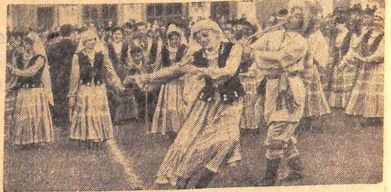
Праздником на стадионе имени Гастелло в Уфе начались массовые выступления спортивных и самодеятельных коллективов республики в честь 50-летия Советской власти.