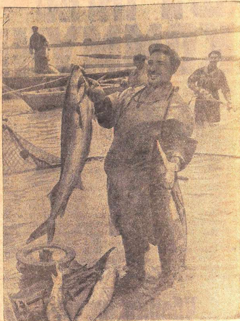
С хорошим уловом!

Воодушевленные решениями партии, советские рыбаки встречают свой праздник новыми трудовыми успехами.