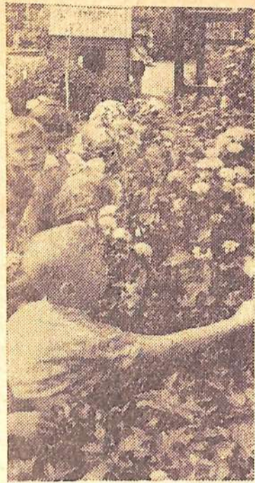
В детсаде № 15 много цветов, зелени. Приятно ребятишкам играть среди цветников.