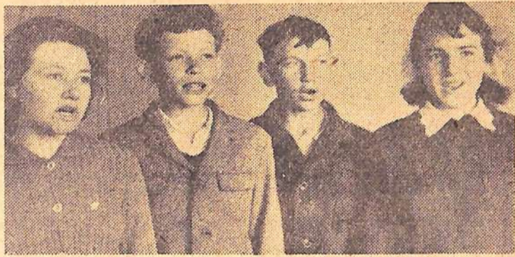
Большой популярностью в Натальине пользуется вокальная группа школьников.

Еще шли экзамены, а в школе начался ремонт. Покрашены окна, стены. Весело и гордо блещет пол, еще не оскорбленный действием беспокойных и бесцеремонных ног маленьких человечков, грызущих гранит наук. В школе пахнет каким-то новым, свежим запахом. И от него еще более грустно. Ведь сколько лет для нас центром была школа. Она стала для нас живым существом, щедро дающим интересное и нужное. Неужели больше не придем мы