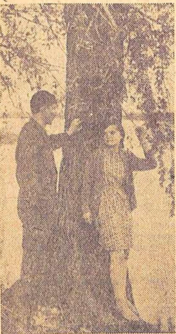
Первая любовь.