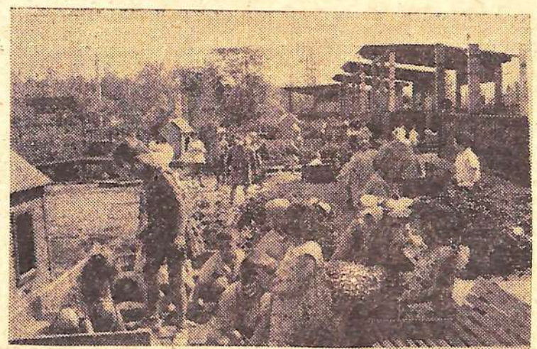
Большую часть времени малыши детских садов проводят сейчас на воздухе. Строят домики из песка, прыгают на скакалках, играют в подвижные игры.