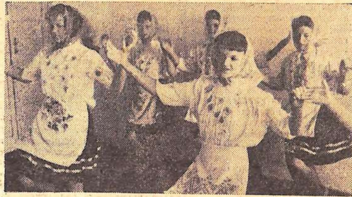
Тепло и сердечно встречают самодеятельных артистов Натальинской школы колхозники. Они часто выступают перед ними в торжественные и праздничные дни. Это выступает танцевальная группа школы на очередном концерте.

23 июня, 18-00 — Для младших школьников. «Приключения котенка». Кукольный спектакль. 18-35 — «Мы любим рисовать». Передача для школьников. 19-05 — Земля саратовская. 19-20 — Экономисты за круглым столом. (Экономические проблемы сельского хозяйства). 20-00 — Спектакль Новосибирского государственного драматического театра «Красный факел». 22-00 — Фильм советского телевидения. 22-30 — На III Международном конкурсе П. И. Чайковского. 23-00 — Физкультура и спорт. «Два тайма большого футбола». (Программа посвящается чемпионату мира по футболу). 23-45 — Концерт французской песни.