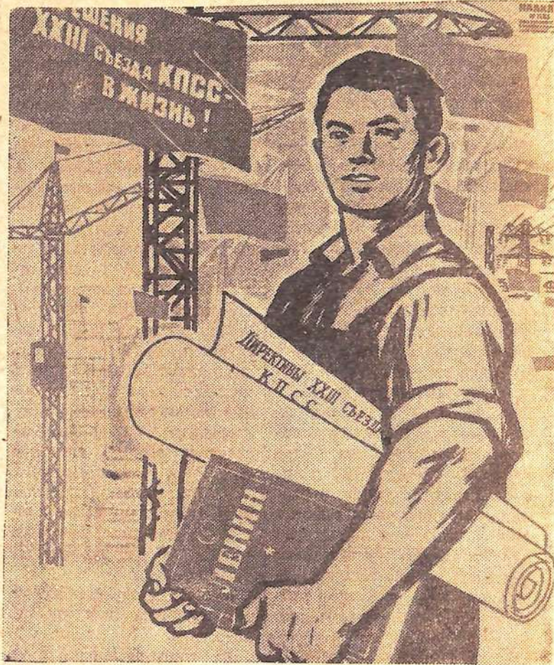
Плакат художника В. Сурьянинова. (Издательство «Агитплакат»).

Жизнь требует дальнейшего повышения роли и активности всех партийных групп, чтобы они настойчиво влияли на производство и больше уделяли внимания коммунистическому воспитанию трудящихся. М. ПАТРИКЕЕВ.