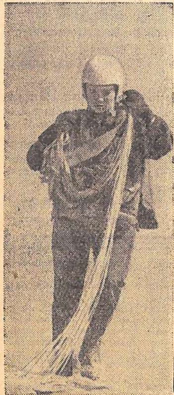
Киргизская ССР. Сборная команда парашютистов СССР

проводит здесь тренировки, готовясь к предстоящему 8-му первенству мира по парашютному спорту. Чемпионат состоится в июле этого года в Лейпциге (ГДР).