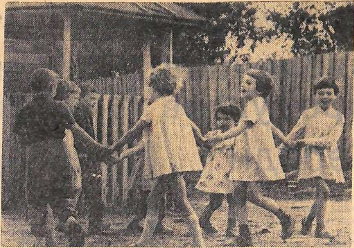
Это играют дети в детсаду колхоза имени Ф. Э. Дзержинского. Их родители на работе, а они интересно проводят свой день под присмотром воспитателей.