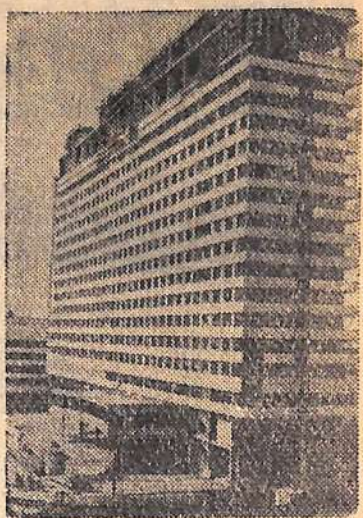
Закончен монтаж высотной части здания первой очереди крупнейшей в Ленинграде гостиницы «Советская», строящейся на Лермонтовском проспекте. 19-этажный отель намечено сдать в эксплуатацию в этом году.

Как ни странно, недавно обед был задержан на два часа из-