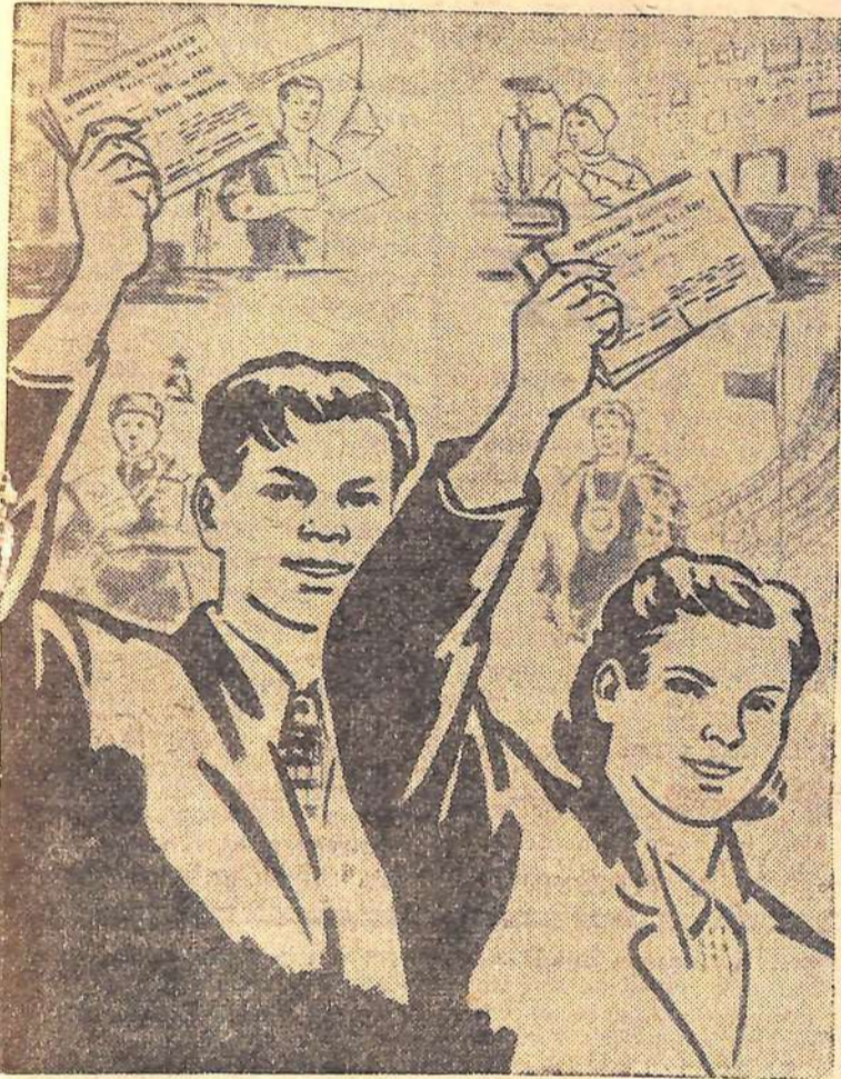
Плакат художника М. Соловьева. (Издательство «Агитплакат»)