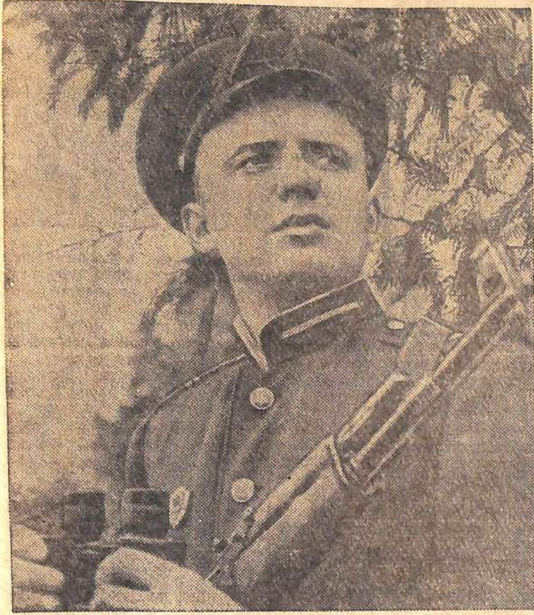
Бдительно несет службу на границе воин в зеленой фуражке!

Ежегодно в нашей стране как большой всенародный праздник отмечается День пограничника. На десятки тысяч километров протянулась государственная граница Советского Союза. На островах и скалистом побережье Северного Ледовитого океана, на Чукотке и Камчатке, на Сахалине и в дальневосточной тайге, в горах Памира и песках Средней Азии, на Каспии и Кавказе, на западных рубежах нашей Родины днем и ночью, в мороз и жару несут свою бессменную вахту зоркие часовые.