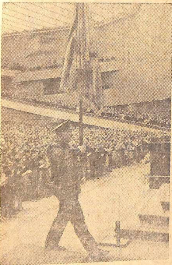
Москва. Кремлевский Дворец съездов. XV съезд ВЛКСМ. На спичке: летчик-космонавт А. Леонов несет знамя Ленинского комсомола.