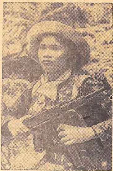
Снайпер Армии освобождения. Без промаха бьет автомат этой женщины по врагу, посягнувшему на независимость ее родины.

Американские воинские части нередко неделями бродят по джунглям, безуспешно пытаются «войти в соприкосновение с подразделениями Армии освобождения. При этом они натываются на искусно устроенные засады и несут большие потери. Стоит им закончить «прочесывание» какого-либо района, как патриоты вновь