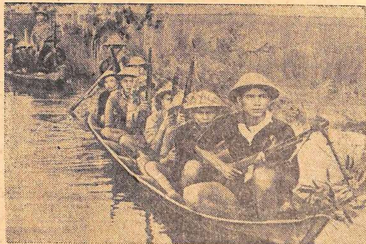
Партизанские отряды в Южном Вьетнаме совершают смелые налеты на базы и аэродромы американских оккупантов, разрушают посты марионеточных войск.

На снимке: патриоты направляются на боевую операцию.